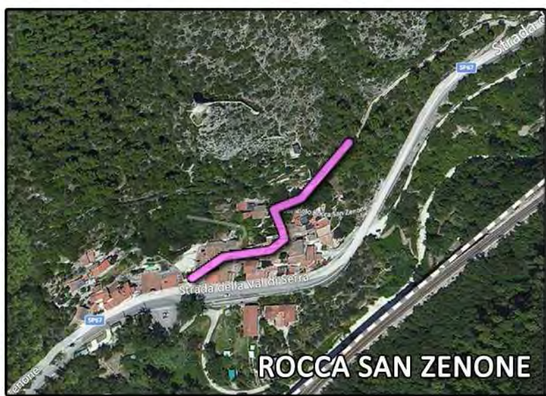
ROCCA SAN ZENONE