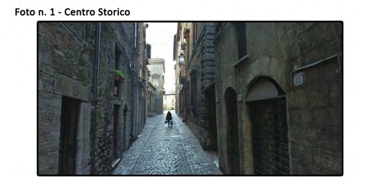
Viabilità con ridotte dimensioni e necessità di eventuale piano di divieto di sosta. Solitamente pavimentazione in autobloccanti particolarmente delicata. Effettuare solo spazzamento manuale.