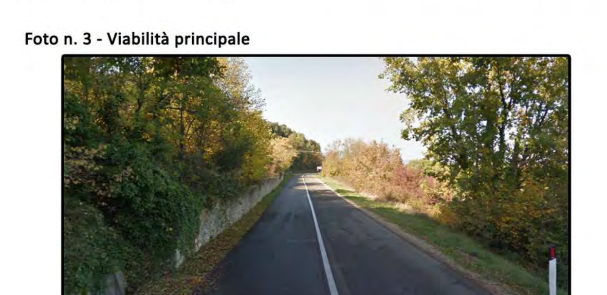
Viabilità principale in uscita dal capoluogo. Assenza marciapiedi. Banchine in terra. Spazzamento meccanizzato possibile ponendo attenzione all'asportazione di sabbia e terriccio.