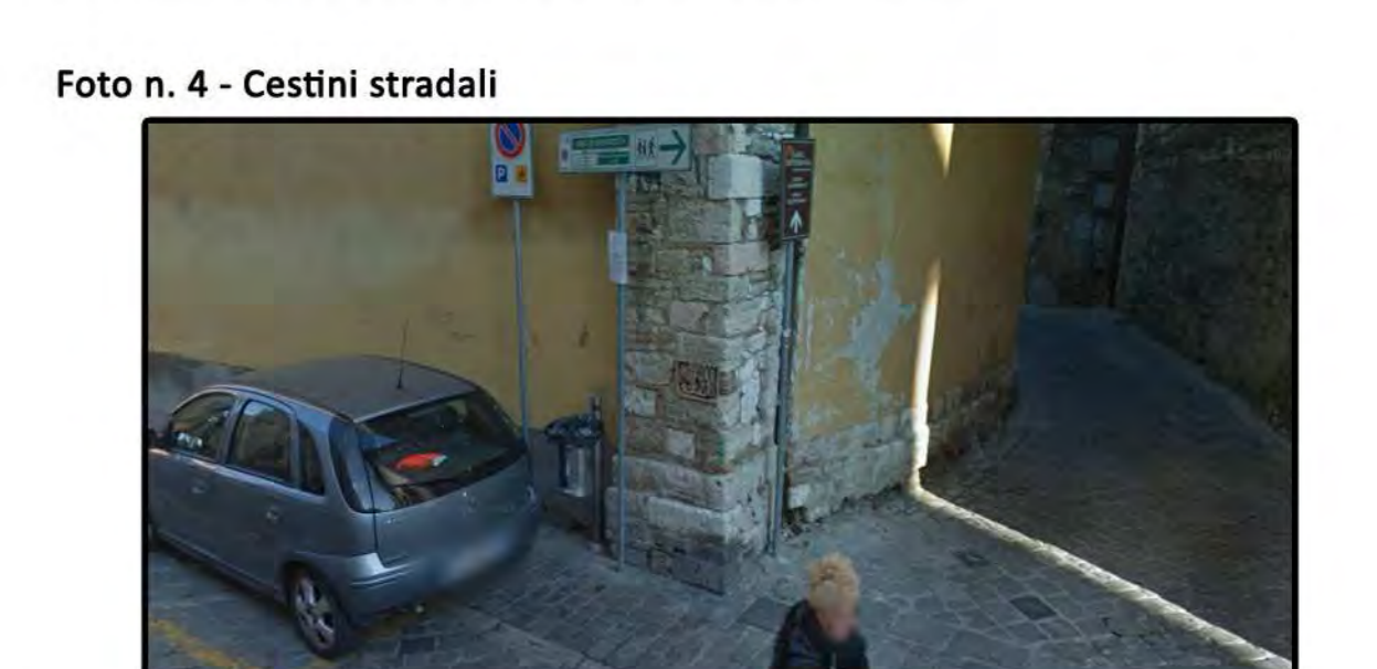
Analisi tipologia cestini stradali. Svuotamento sia dedicato che in abbinamento ai servizi di igiene urbana. Segnalare situazione di particolare degrado e necessità di riparazione o sostituzione.