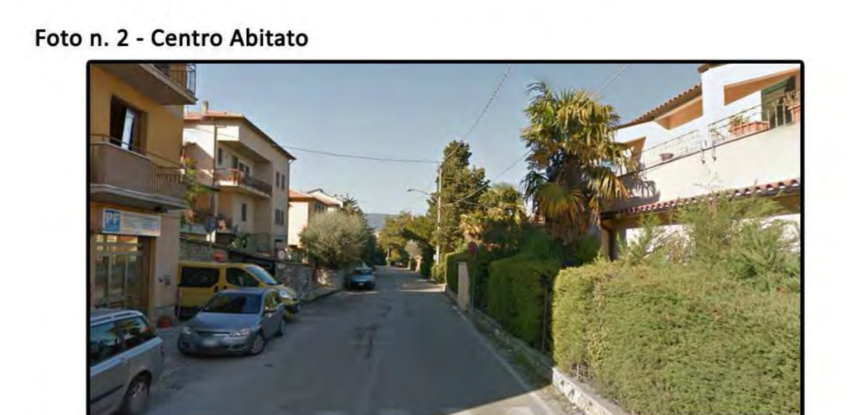
Viabilità di centro paese. Porre particolare attenzione pulizia marciapiedi ove presenti. Valutare piano divieti di sosta. Possibile spazzamento meccanizzato.