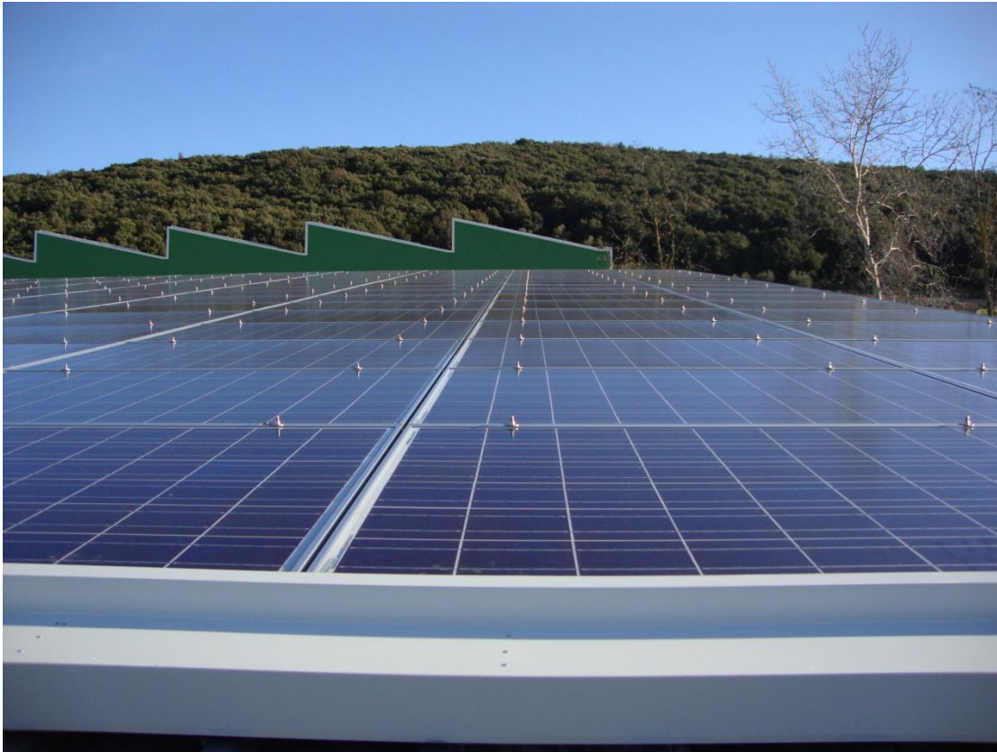
METALMECCANICA PULSONI – impianto fotovoltaico da 300kwp a servizio del capannone industriale sito in Amelia (TR)