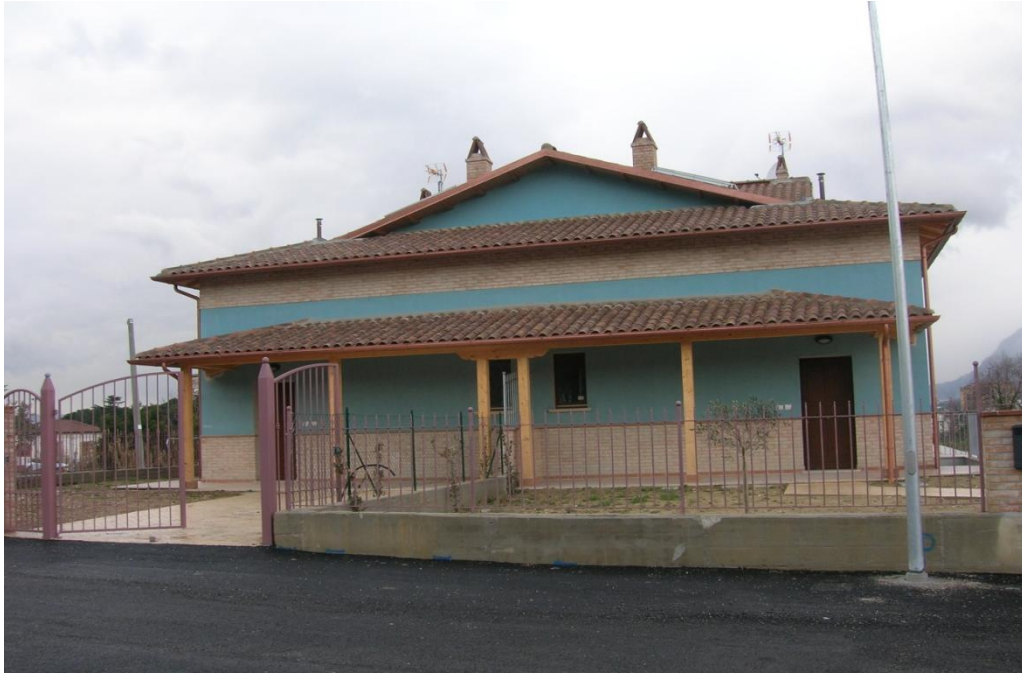
Società Italiana Costruzioni – SIC spa urbanizzazione di via Campomicciolo-via Urbinati (Terni)