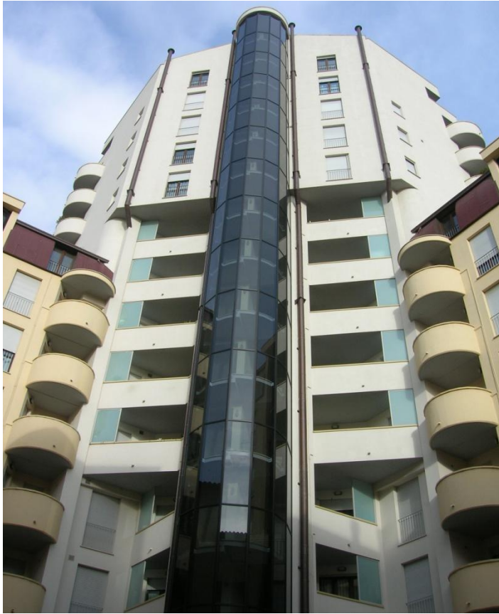
Immobiliare Rigoletto S.r.l. – il complesso immobiliare sito in via Battisti (TR)