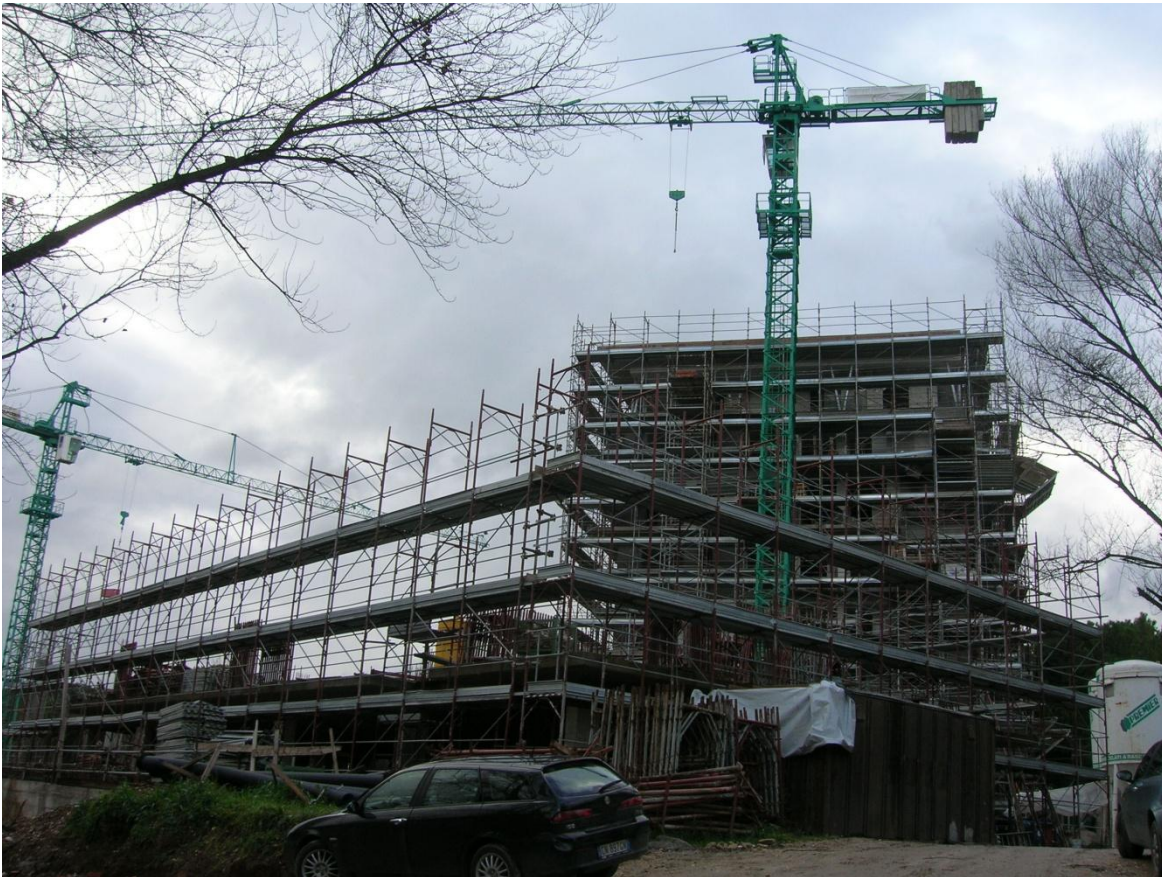
Cantiere Centro Appalti srl , per Urbanizzazione di Via VIII Marzo e Via Malnati (Terni)