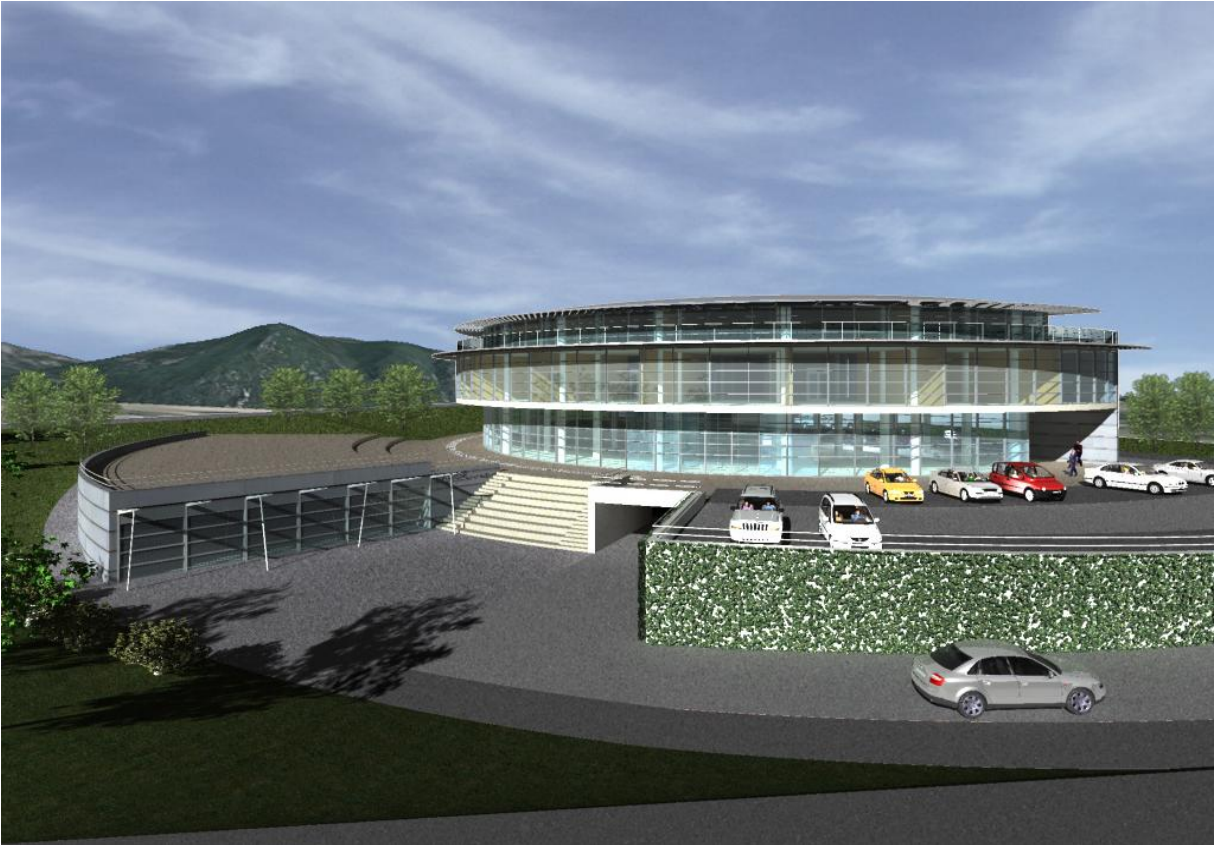
Società Italiana Costruzioni –(TR) SIC spa – Sistemazione urbana di via Bramante (Terni)