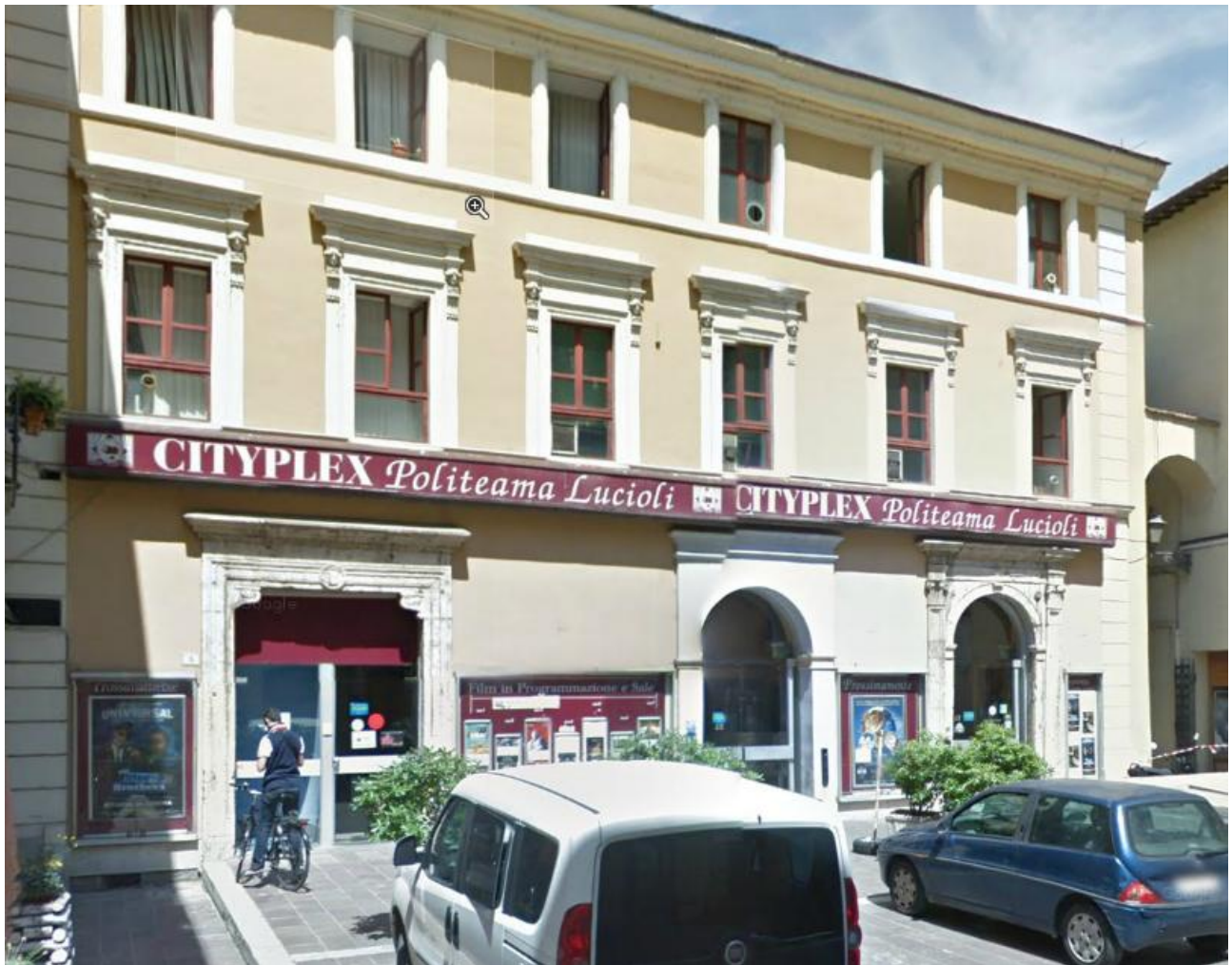
- Politeama Lucioi - il palazzo sede del cinema, sito in via Roma (TR)