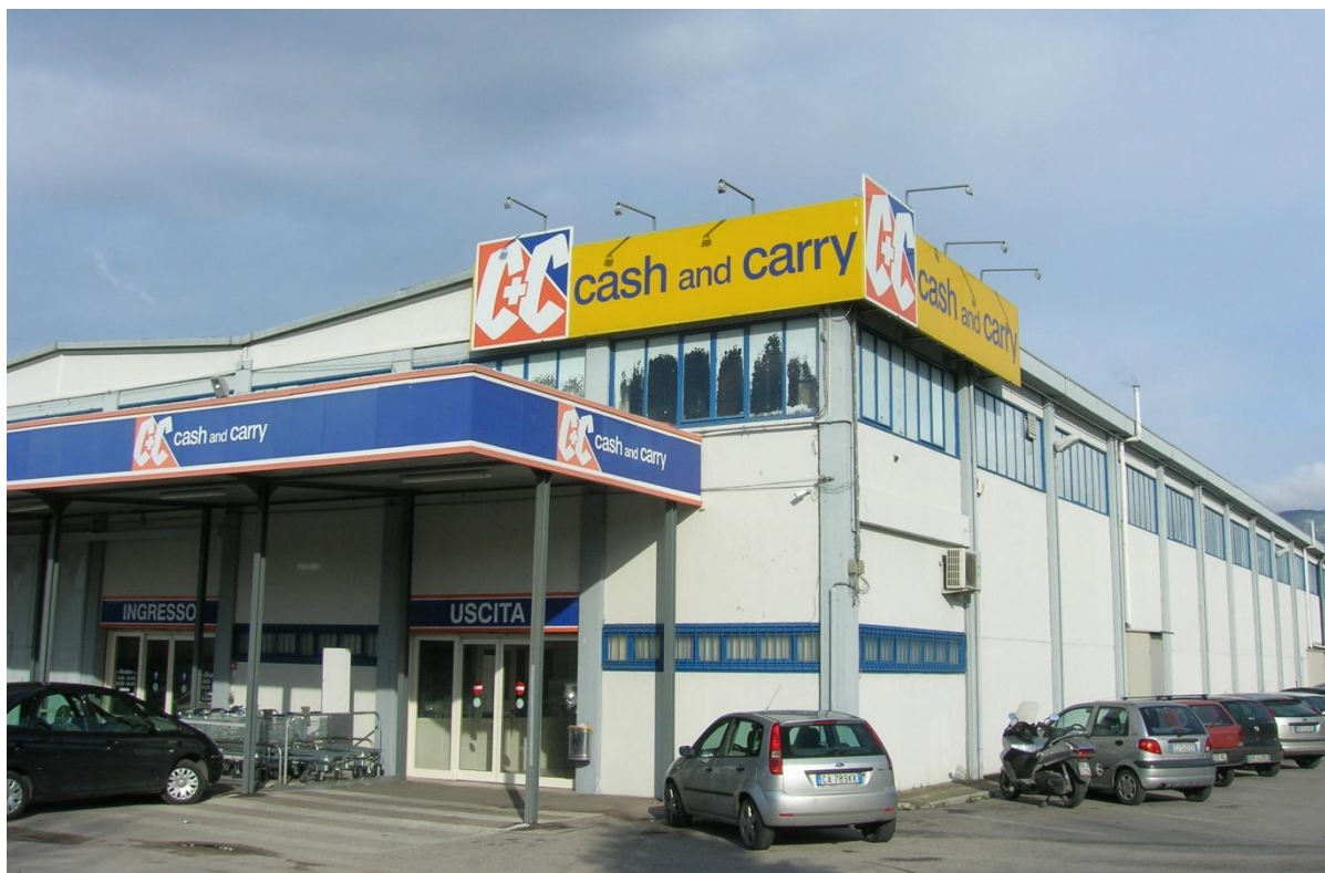
G.M.F. S.p.a. - il capannone di cash and carry sito in z.i. Sabbione, Terni (TR)