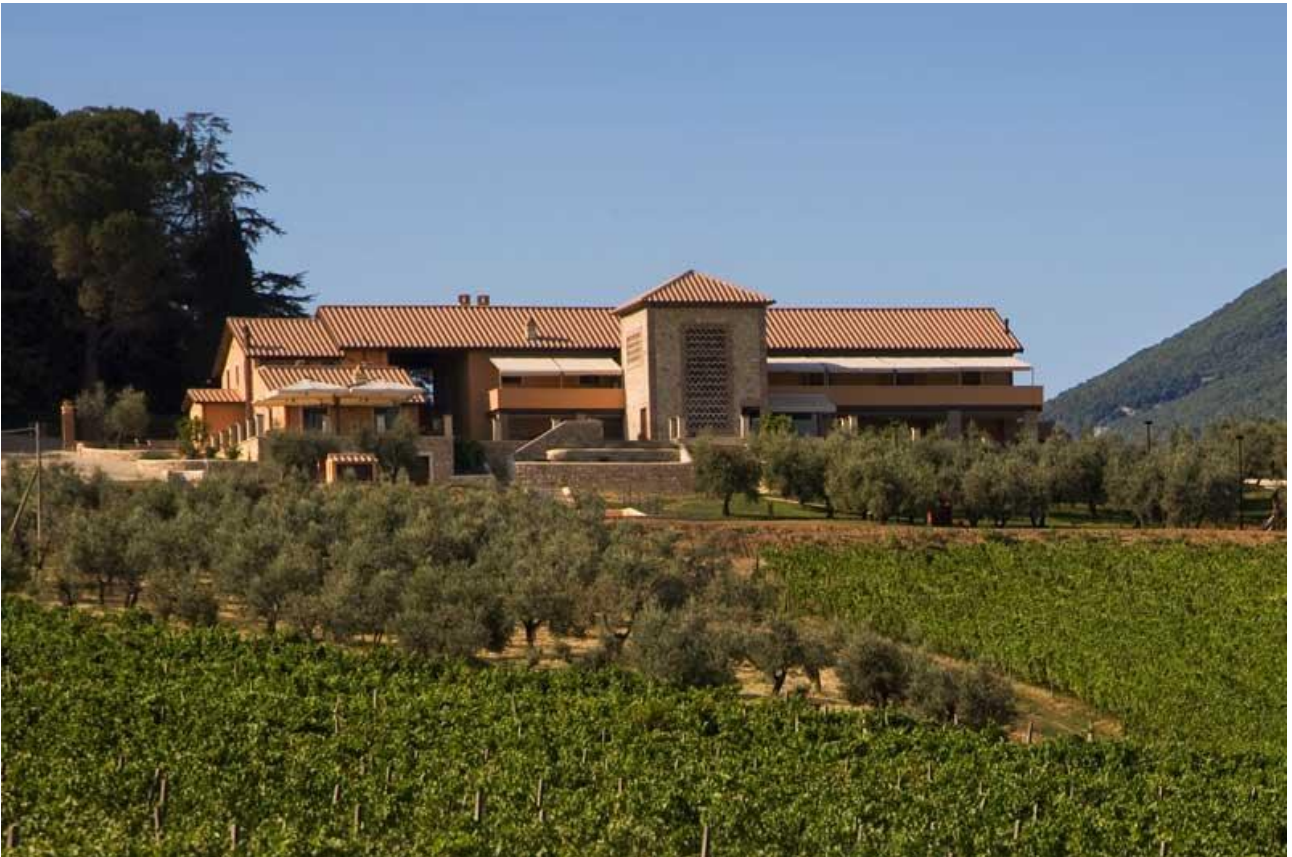
Società Agricola “Le Colline” - Ristorante, agriturismo e beauty-farm sito in loc. Vallantica, San Gemini (TR)