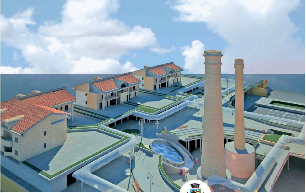
Società Italiana Costruzioni – SIC spa “Urbanizzazione zona ex ceramiche Marcantoni ” Civita Castellana - VT