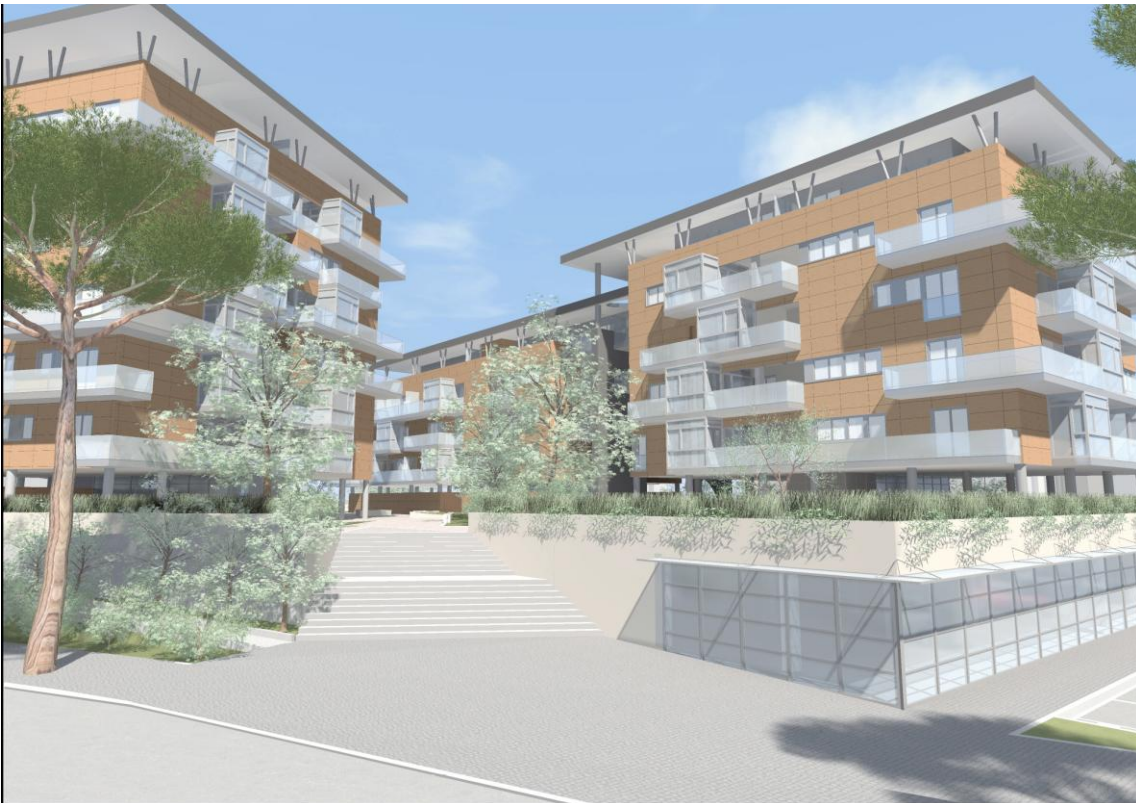
Centro appalti srl - “Urbanizzazione di via VIII Marzo e via Malnati” (TR)