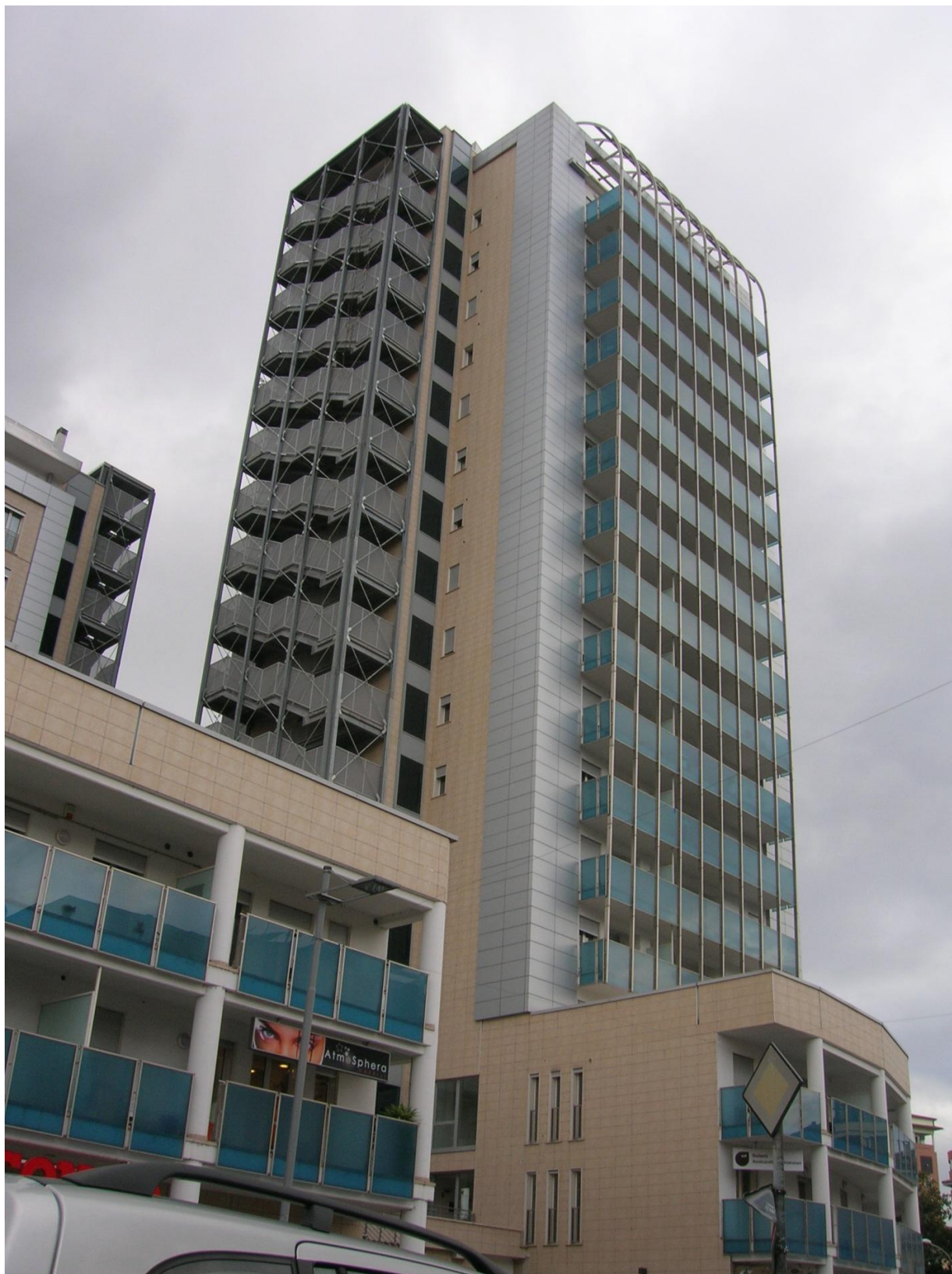
-Impresa Castellani & Gelosi – il complesso immobiliare denominato “Le torri” , via Mentana (TR)