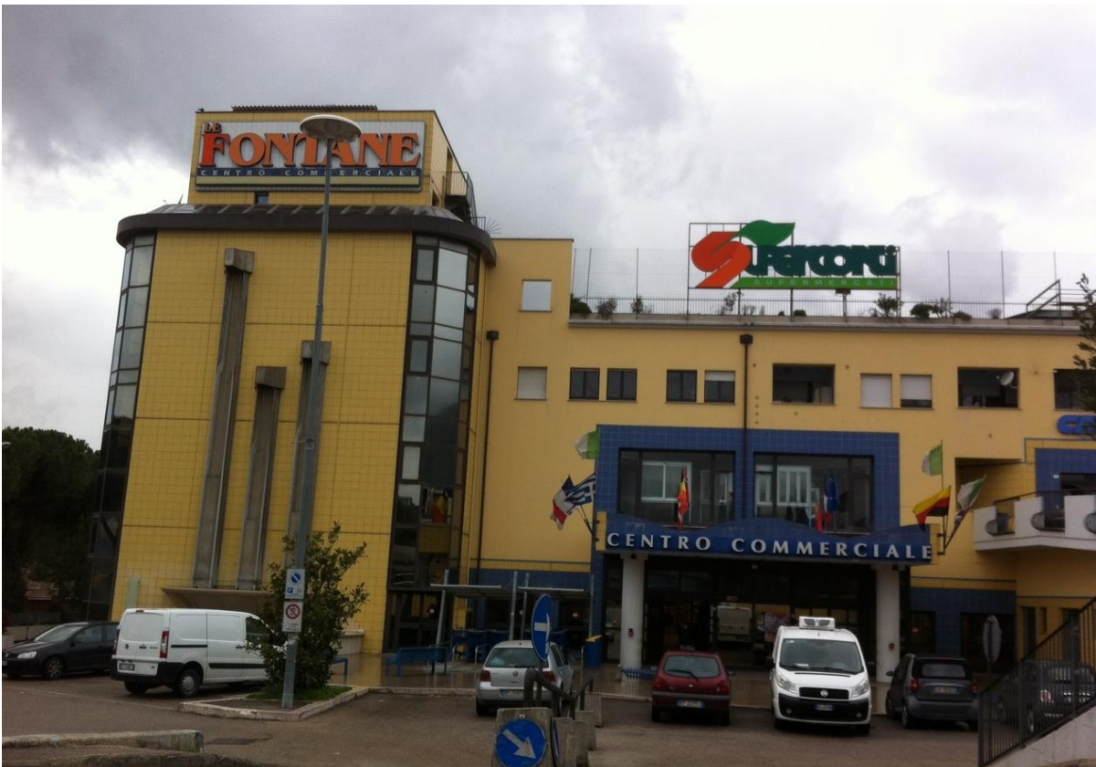
- Le Fontane s.r.l. - il centro commerciale sito in via della Stadera, Terni (TR)