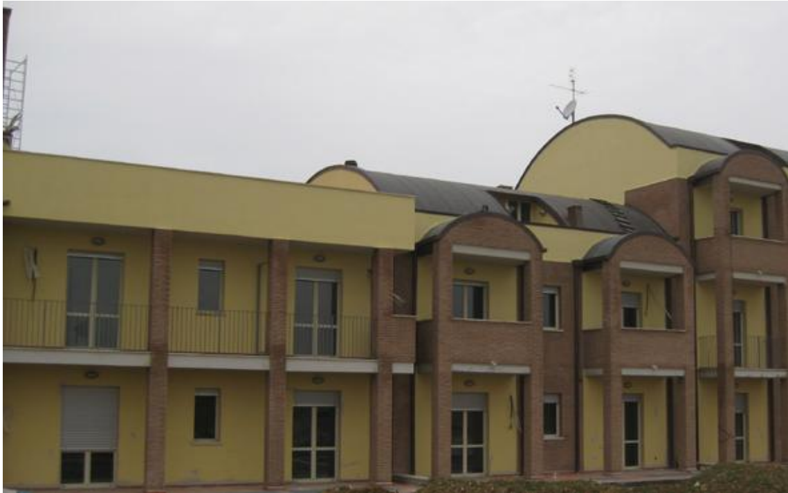
Castellani & Gelosi s.r.l. - complesso immobiliare sito in Madonna del Piano (PG)