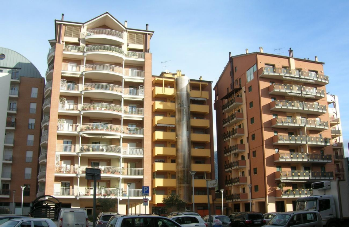
Il complesso immobiliare di via C. Battisti (TR)