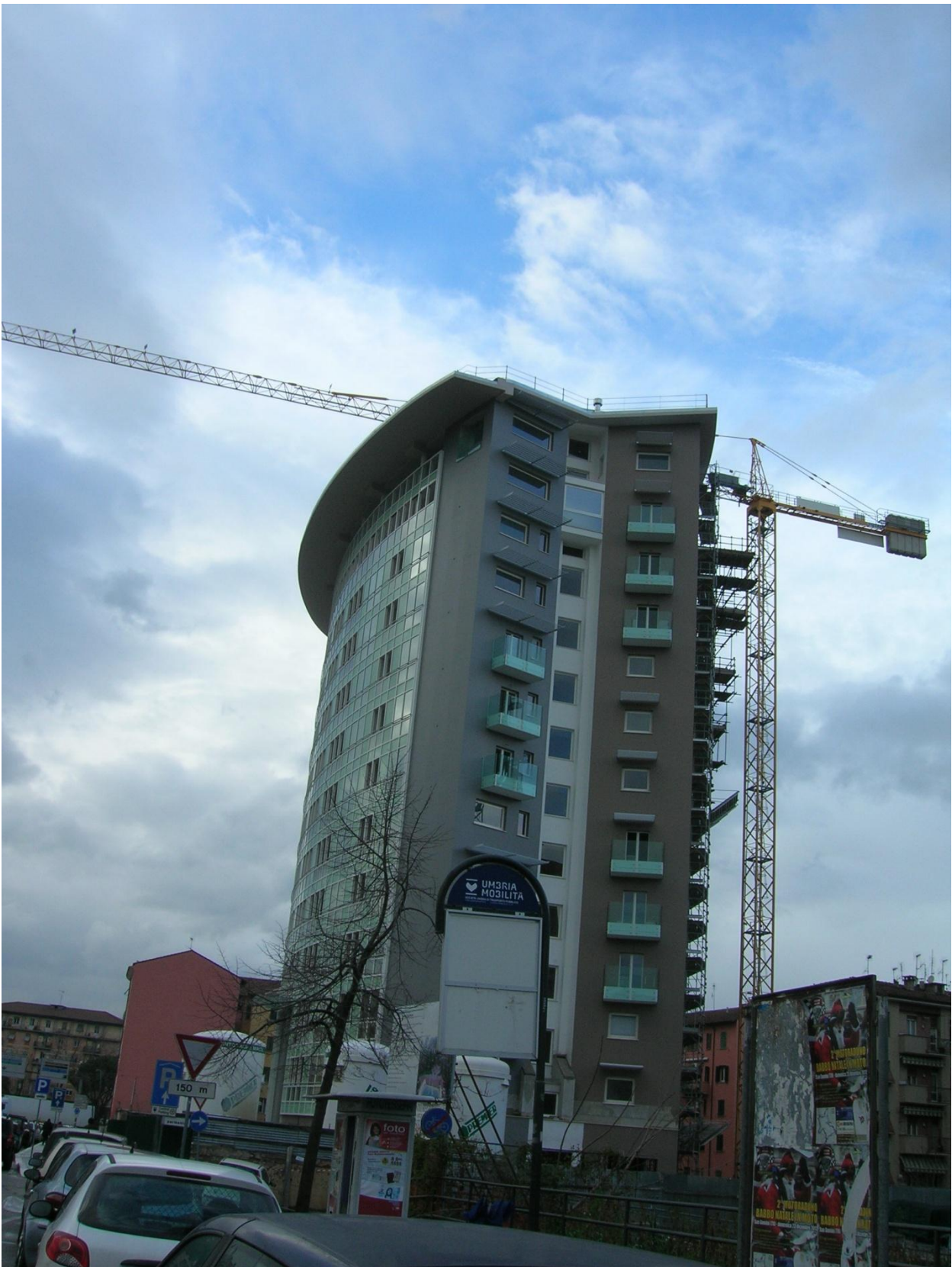
Impresa Ponteggia s.n.c. – cantiere del complesso immobiliare sito in via Gramsci (TR)