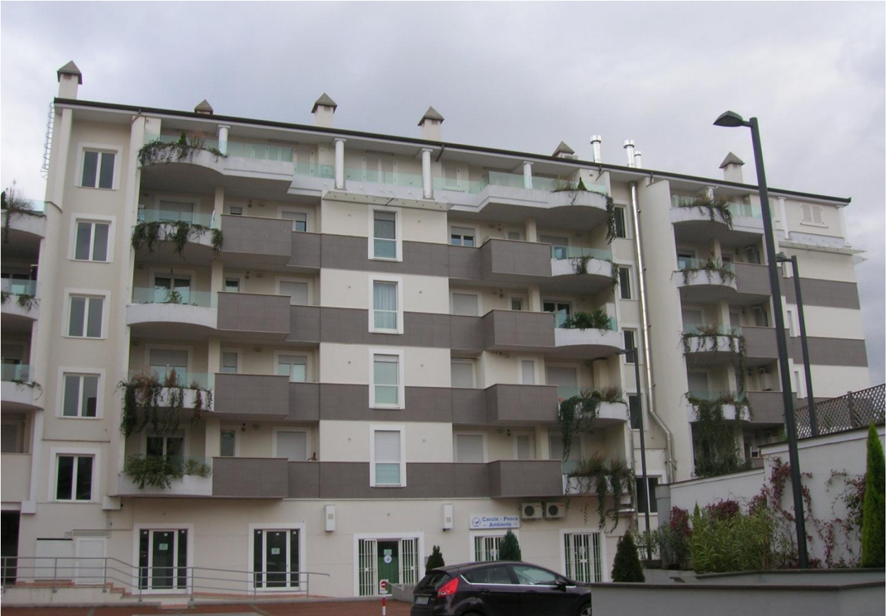
Impresa Ponteggia s.n.c. – Il complesso immobiliare sito in via del Lanificio (TR)