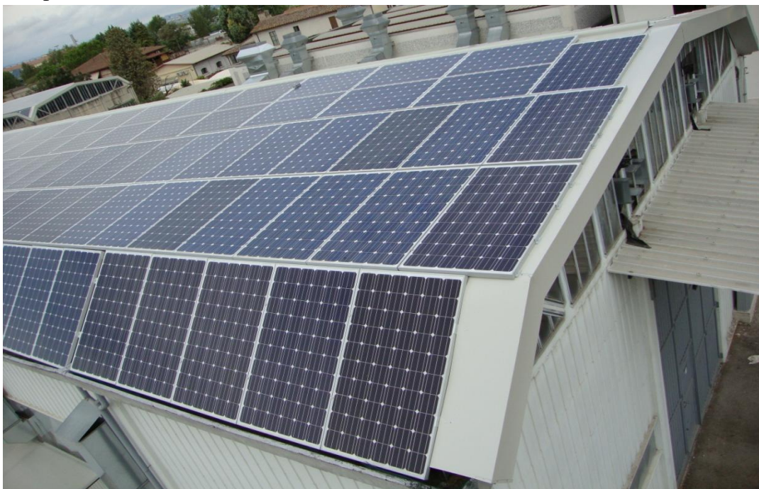
2Poffice&House s.r.l – Impianto fotovoltaico da 37,5kwp a servizio di un capannone industriale sito in Terni (TR)