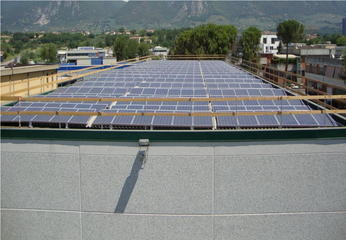
FERROCART s.r.l. - Impianto fotovoltaico da 180,24 kwp a servizio dei capannoni siti in z.i. Maratta (TR)