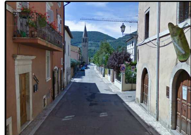
Foto n. 2 - Centro Abitato

Viabilità di centro paese con attività commerciali. Porre parti- colare attenzione pulizia marciapiedi fronte attività. Valutare piano divieti di sosta. Possibile spazzamento meccanizzato