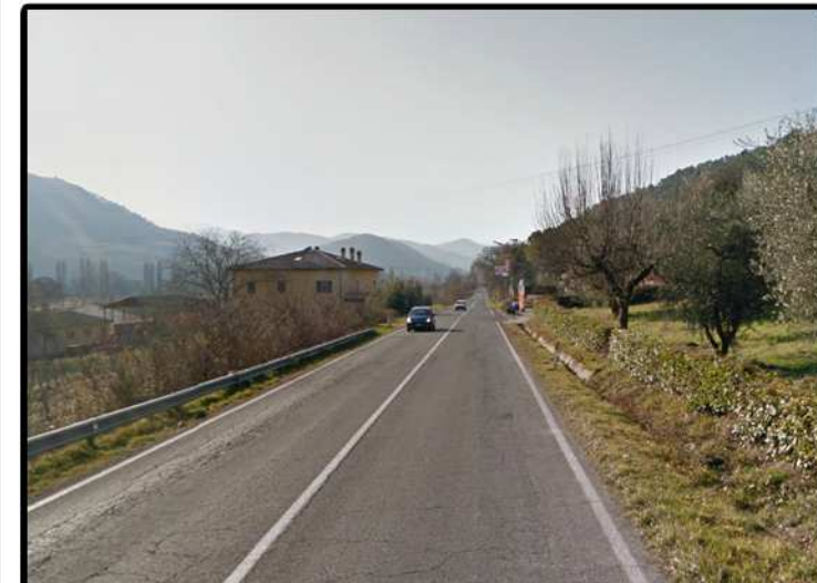
Foto n. 3 - Viabilità principale

Viabilità principale in uscita dal capoluogo. Assenza marcia- piedi. Banchine in terra. Spazzamento meccanizzato possibile ponendo attenzione all'asportazione di sabbia e terriccio.