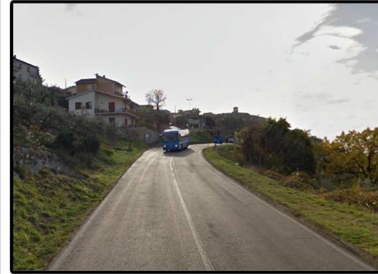
Foto n. 3 - Viabilità principale

Viabilità principale in uscita dal capoluogo. Assenza marciapiedi. Banchine in terra. Spazzamento meccanizzato possibile ponendo attenzione all'asportazione di sabbia e terriccio.