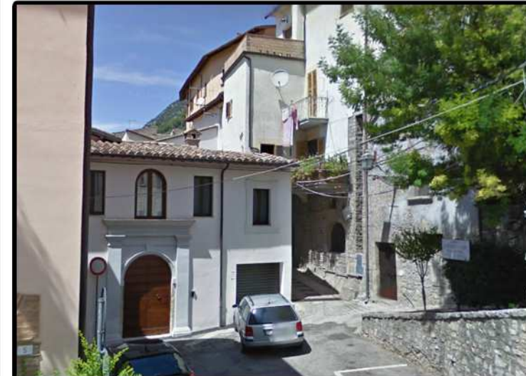
Foto n. 1 - Centro Storico

Viabilità con ridotte dimensioni e necessità di eventuale piano di divieto di sosta. Solitamente pavimentazione in autobloccanti par- ticolarmente delicata. Effettuare solo spazzamento manuale