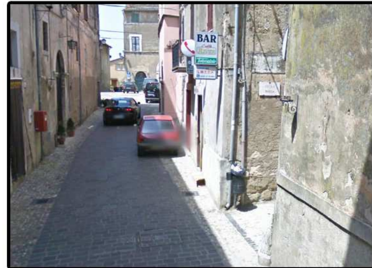
Foto n. 4 - Cestini stradali

Analisi tipologia cestini stradali. Svuotamento sia dedicato che in abbinamento ai servizi di igiene urbana. Segnalare situazione di particolare degrado e necessità di riparazione o sostituzione.