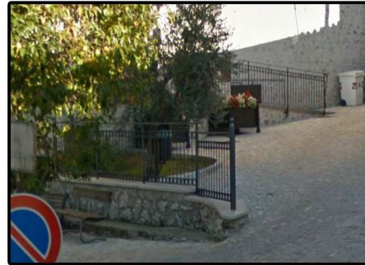
Foto n. 4 - Cestini stradali

Analisi tipologia cestini stradali. Svuotamento sia dedicato che in abbinamento ai servizi di igiene urbana. Segnalare situazione di particolare degrado e necessità di riparazione o sostituzione.