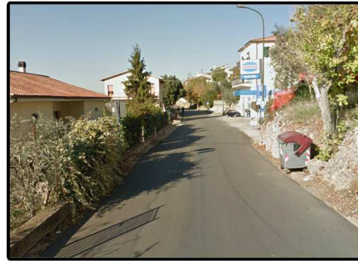
Foto n. 2 - Centro Abitato

Viabilità di centro paese. Porre particolare attenzione pulizia marciapiedi ove presenti. Valutare piano divieti di sosta. Possibile spazzamento meccanizzato