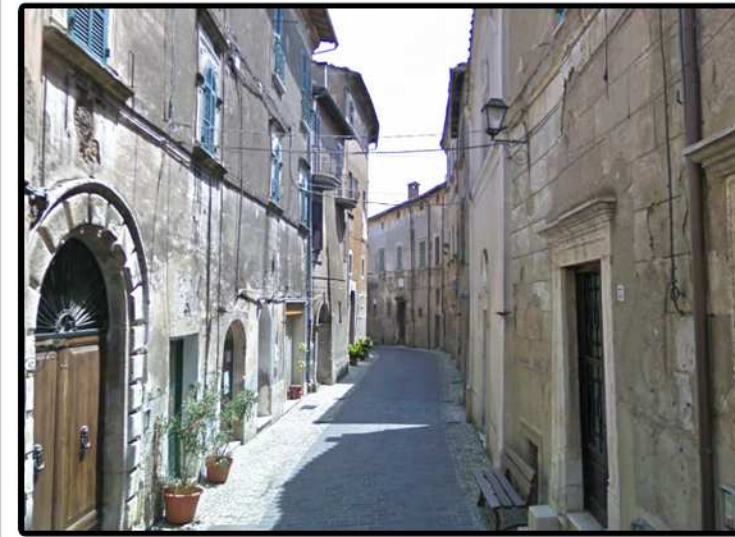
Foto n. 1 - Centro Storico

Viabilità con ridotte dimensioni e necessità di eventuale piano di divieto di sosta. Solitamente pavimentazione in autobloccanti particolarmente delicata. Effettuare solo spazzamento manuale