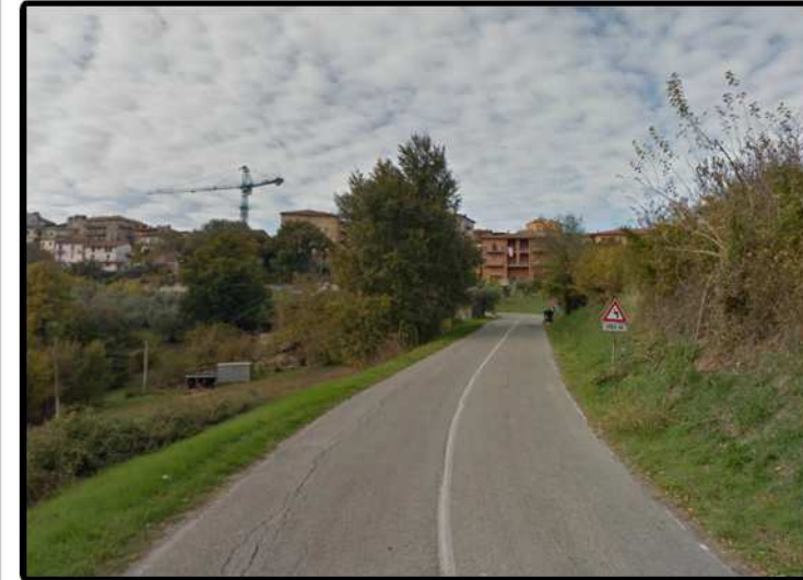
Foto n. 3 - Viabilità principale

Viabilità principale in uscita dal capoluogo. Assenza marciapiedi. Banchine in terra. Spazzamento meccanizzato possibile ponendo attenzione all'asportazione di sabbia e terriccio.