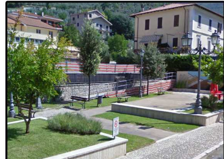
Foto n. 4 - Cestini stradali

Analisi tipologia cestini stradali. Svuotamento sia dedicato che in abbinamento ai servizi di igiene urbana. Segnalare situazione di particolare degrado e necessità di riparazione o sostituzione.