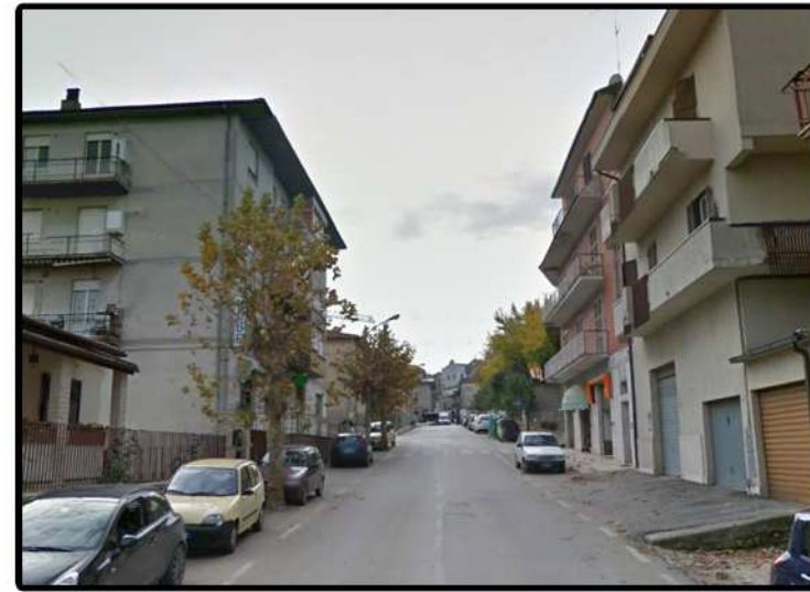
Foto n. 2 - Centro Abitato

Viabilità di centro paese con attività commerciali. Porre particolare attenzione pulizia marciapiedi fronte attività. Valutare piano divieti di sosta. Possibile spazzamento meccanizzato