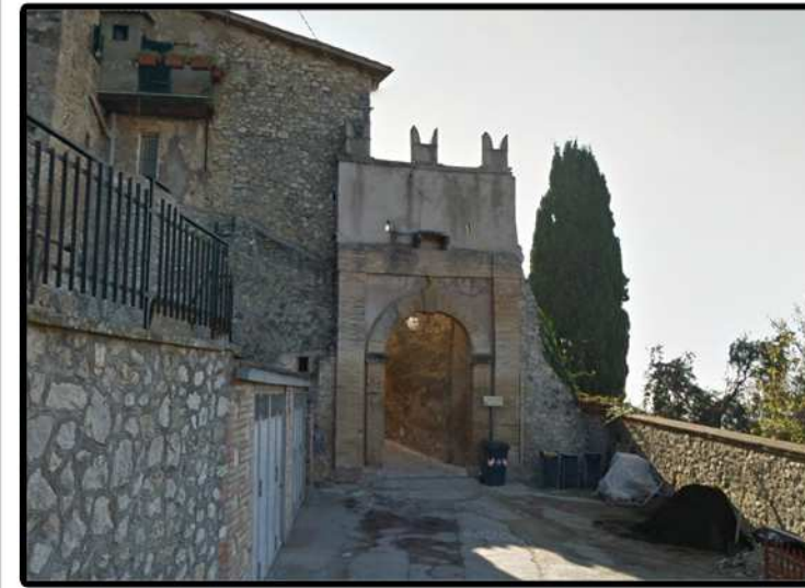
Foto n. 1 - Centro Storico

Viabilità con ridotte dimensioni. Solitamente pavimentazione in autobloccanti particolarmente delicata. Effettuare solo spazzamento manuale